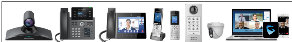
Dispositivos de rede internos